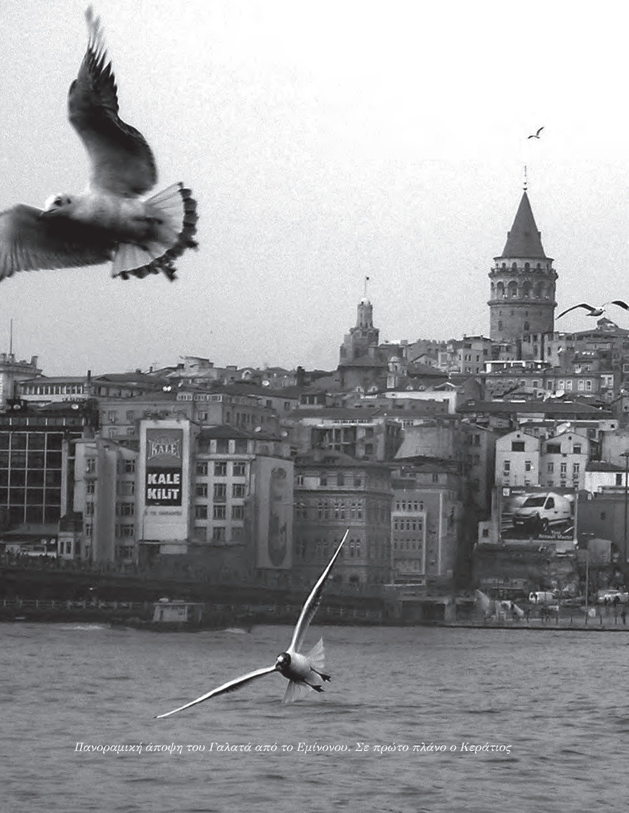
Πανοραμική άποψη του Γαλατά από το Εμίνονου. Σε πρώτο πλάνο ο Κεράτιος