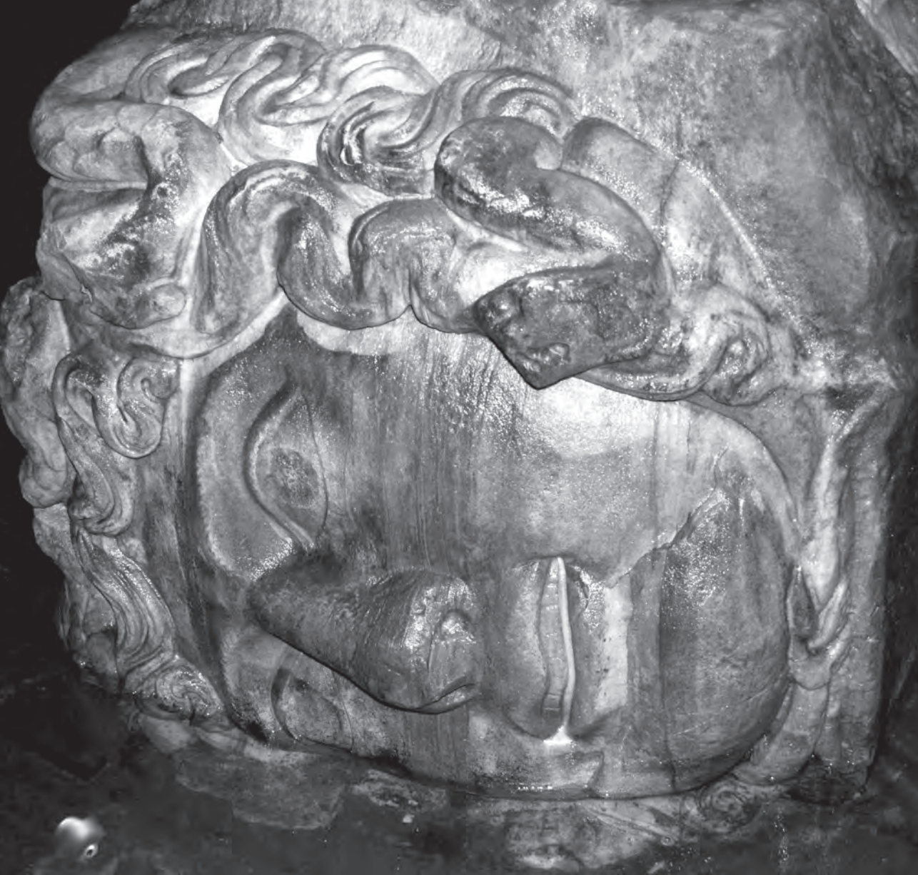
Φωτογραφία της Μέδουσας από τη Βασιλική Κινστέρνα (Δεξαμενή)

και εντυπωσιακότερη είναι η Βασιλική Κινστέρνα, που οι Τούρκοι ονόμασαν Yerebatan Saray («βυθισμένο παλάτι»). Βρίσκεται σε απόσταση λίγων μέτρων από την Αγία Σοφία. Ο Γάλλος τυχοδιώκτης Pierre Gilles ισχυρίζεται ότι την «ανακάλυψε» γύρω στο 1550, και κάνει λόγο για μεγάλη αφθο-